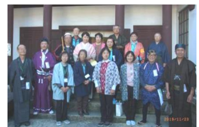
(時代劇のまち近江八幡)