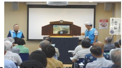
(紙芝居チームとのコラボ)