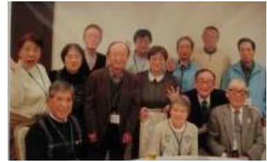
(事業運営部出席者)