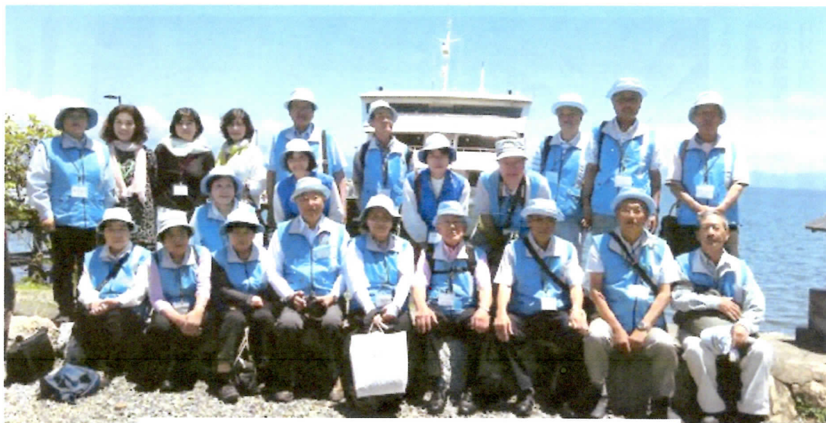
高島市今津港ピアンカをバックに記念写真